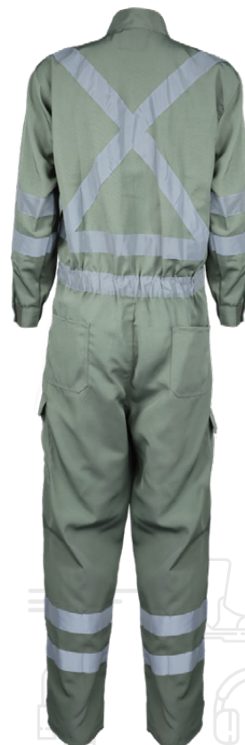
TABLA DE TALLAS (CM)