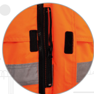
Bolsillo para teléfono móvil en pecho.