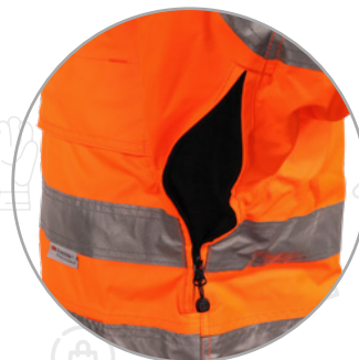
Ventilación de cremalleras en axilas, con costuras selladas.