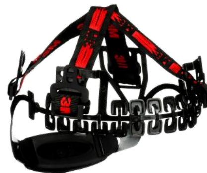
Suspensión Ratchet SecureFit™